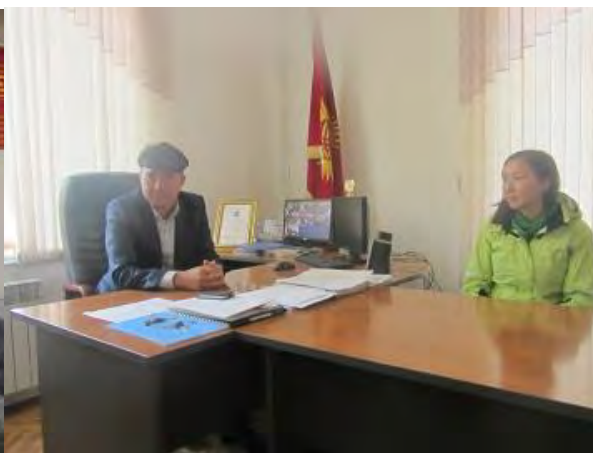
Инструктаж главы Айыл Окмоту