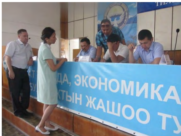
ГРЖ Жайыльского района