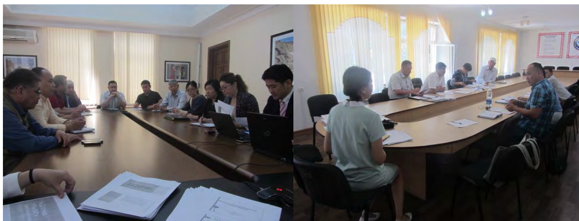
Заседание АБР РМ по МРЖ для ГРЖ Московского района