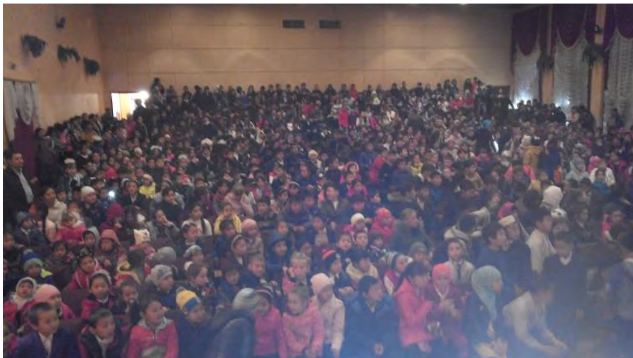
Школа в Петровке