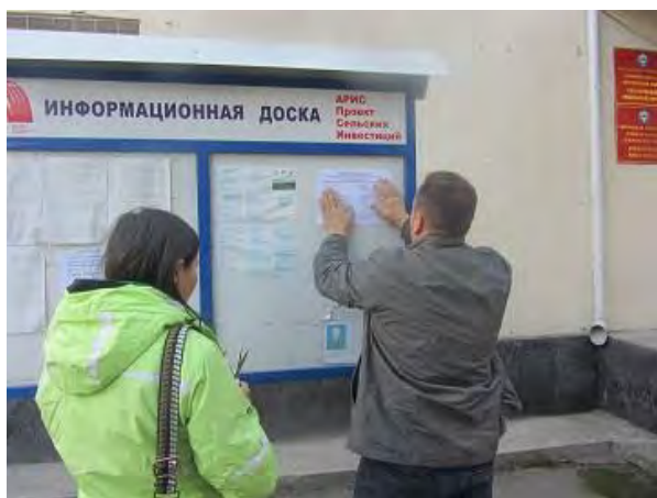
Информация о координаторах ГРЖ

36. Для того чтобы информация о МРЖ была доступна для сообществ Проекта, специалисты по социальной защите ГРИП и Eptisa посетили 11 проектных Айыл Окмоту (местные органы власти) и отобрали на своем информационном табло буклет с именами и контактными номерами координационных центров ГРЖ от Айыл Окмоту, Эптиса, Подрядчика и ГРИП. Кроме того, специалисты по социальной защите провели короткие встречи с каждым главой / заместителем главы Айыл Окмоту и объяснили МРЖ и цель отображения информации для членов сообщества. На встречах представители местных властей выразили удовлетворение проектом. Основные вопросы, заданные на этих встречах, были связаны с началом работ и перемещением коммунальных сооружений.