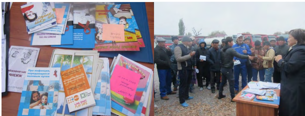
Пособия по профилактике ВИЧ ВИЧ