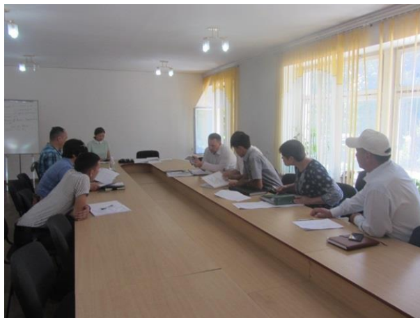
ГРЖ Московского района