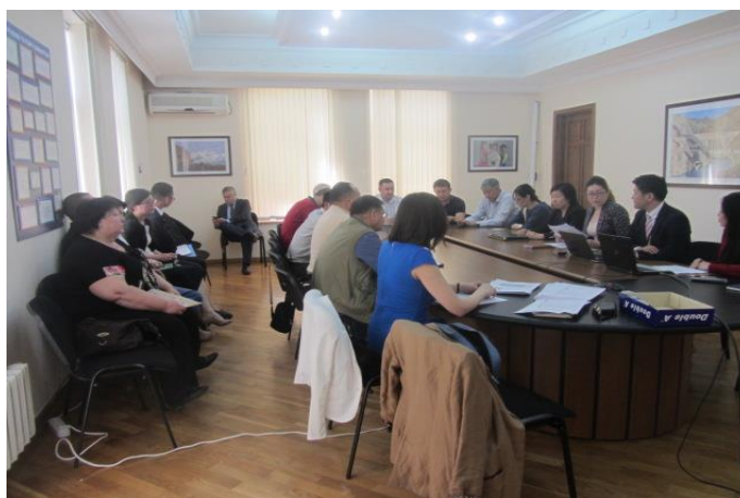
Совместная Сессия по МРЖ

24. Механизм рассмотрения жалоб для этого проекта был создан во время подготовки ППИЗ. По мере начала реализации Проекта возникла необходимость повторно активировать членов ГРЖ на всех уровнях и обучать их задачам, связанным с ППИЗ и реализацией Проекта. 10 мая 2017 года в Бишкеке была проведена сессия по вопросам переселения для членов Группы по рассмотрению жалоб (ГРЖ), координаторов ГРЖ, департаментов прямого действия, консультанта по надзору, подрядчика и НПО. Сессия была организована и совместно проводилась консультантами АБР, Консультантами Eptisa и Специалистом по социальной защите ГРИП. На этой сессии ГРЖ было 15 участников.