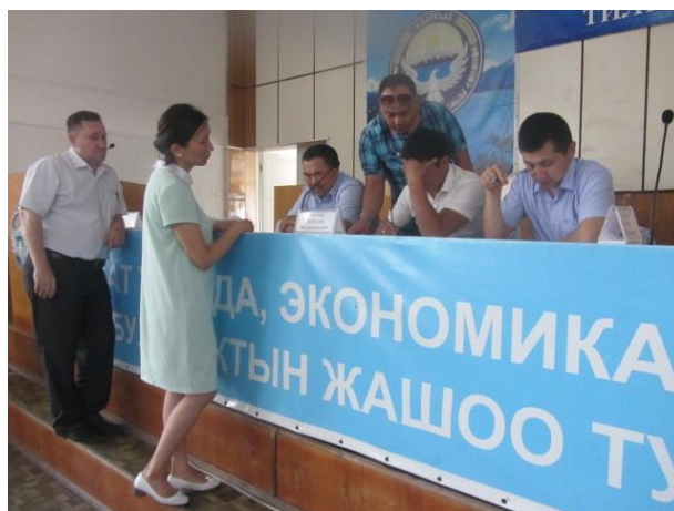
Ролевая игра, ГРЖ Жайыл