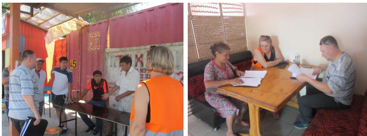
Внеплановая проверка владельцев бизнеса на перемещение контейнеров и Подписание соглашения о перемещении контейнера