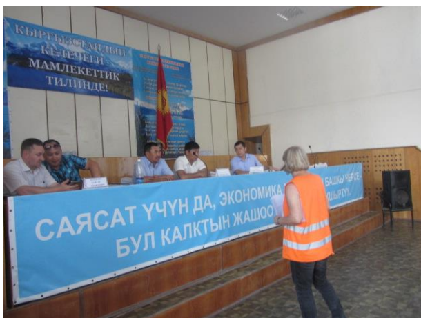
ГРЖ Жайыльского района